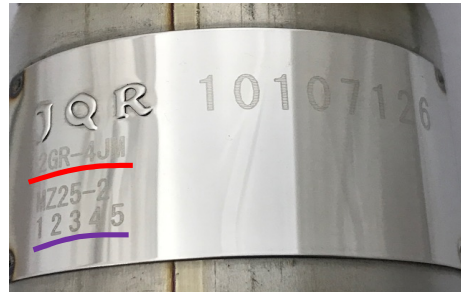
2) 性能等確認済表示