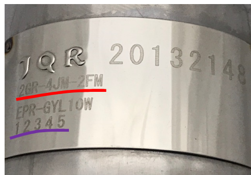
2) 性能等確認済表示 改善前