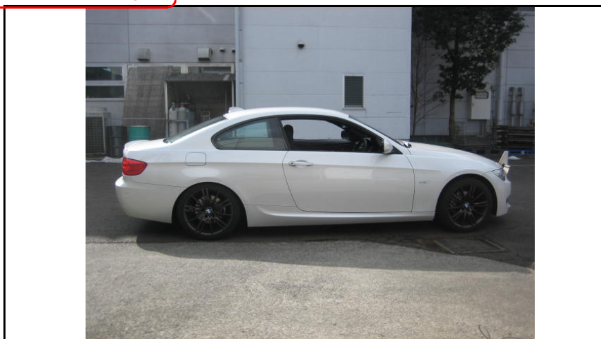
写真2 車両外観(側面)