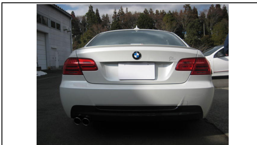
写真3 車両外観(後面)